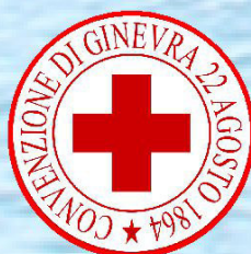
Croce Rossa Italiana