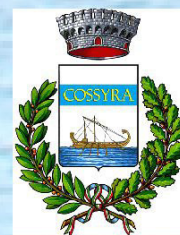
Comune di Pantelleria

Tutte le informazioni ed aggiornamenti sul Congresso saranno consultabili sul sito: